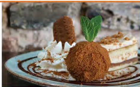
BASTOGNEDESSERT 7 LONGUEUR - & BITTERBAL VAN BASTOGNE